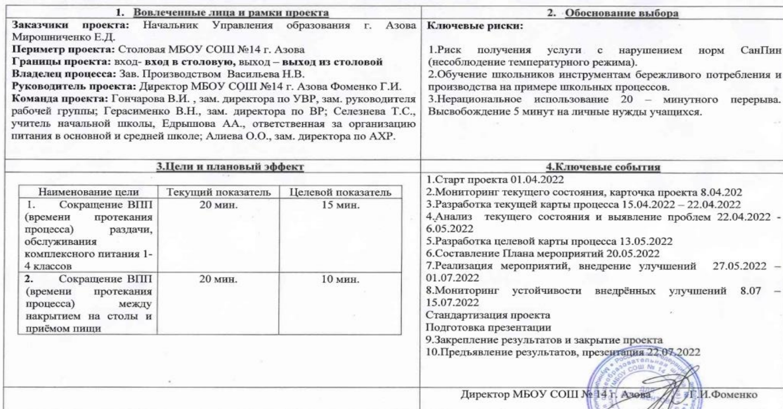
Карточка проекта «Совершенствование процесса организации питания школьников на базе МБОУ СОШ №14 г. Азова