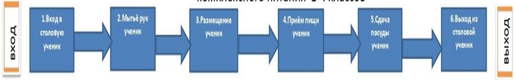
Карта целевого состояния организации комплексного питания 1-4 классов